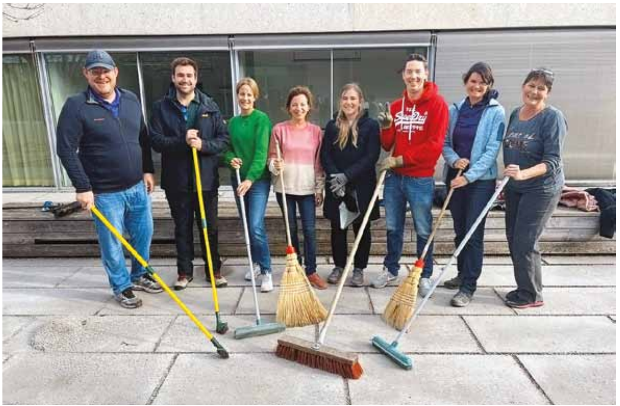
Du gravier, des balais et une tonne de bonne volonté. En novembre, des bénévoles du Crédit Suisse ont remis en état nos sentiers pavé et la cour intérieure de l'école. Un grand merci pour ce formidable travail.

Nous avons revu le déroulement des journées de visites chaque premier samedi du mois, pour les fixer à 10 et 14 heures. Cela permet de mieux planifier la présence du personnel en fonction du nombre de visiteurs. Ce changement a été bien accepté par nos hôtes. Pour ce qui est des dons, l'année 2022 fut assez stable. La rentrée de dons a cependant été moindre que l'année précédente. Des bénéfices substantiels ont toutefois été engendrés. Un grand merci à tous les donateurs et donatrices.