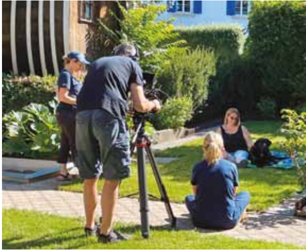
Making of du film du jubilé, où apparaissent les protagonistes de nos quatre secteurs d'activité. L'équipe du film en plein tournage à Winterthour, par une belle journée d'été.

En cours d'année, les premières expériences positives ont été enregistrées avec le nouveau modèle. Dans le cadre de l'élaboration de ce plan, diverses méthodes de formation des chiens ont été discutées et des principes concernant l'ensemble de l'école adoptés.