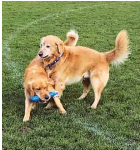
Die beiden Sozialhunde: Nico und Champ.

D er Hund als treuer Gefährte ist wiederkehrendes Thema im Leben von uns Menschen, sei es in Geschichten, Filmen, Dokumentationen oder Biografien. Er ist Freund, Partner, Seelentröster oder Familienmitglied. So ist es nicht verwunderlich, dass der Vierbeiner vermehrt auch in Schulen anzutreffen ist, und dies nicht mehr nur in sonderpädagogischen Bildungseinrichtungen wie z. B. heilpädagogischen Schulen, therapeutischen Schulzentren und Sprachheilschulen, sondern auch an Regelschulen. Ausserdem berufen sich Alters- und Pflegeheime, therapeutische Institutionen oder Hundeschulen bereits seit vielen Jahren auf die dem Hund zugesprochenen Wirkungsbereiche.