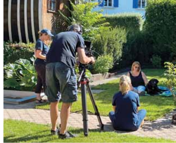
Making of du film du jubilé, où apparaissent les protagonistes de nos quatre secteurs d'activité. L'équipe du film en plein tournage à Winterthour, par une belle journée d'été.

Nos chiens assurent aux personnes devant vivre avec un handicap une plus grande autonomie. C'est la mission que s'efforce de remplir avec patience, expérience et amour l'École de chiens-guides d'Allschwil depuis 50 ans.