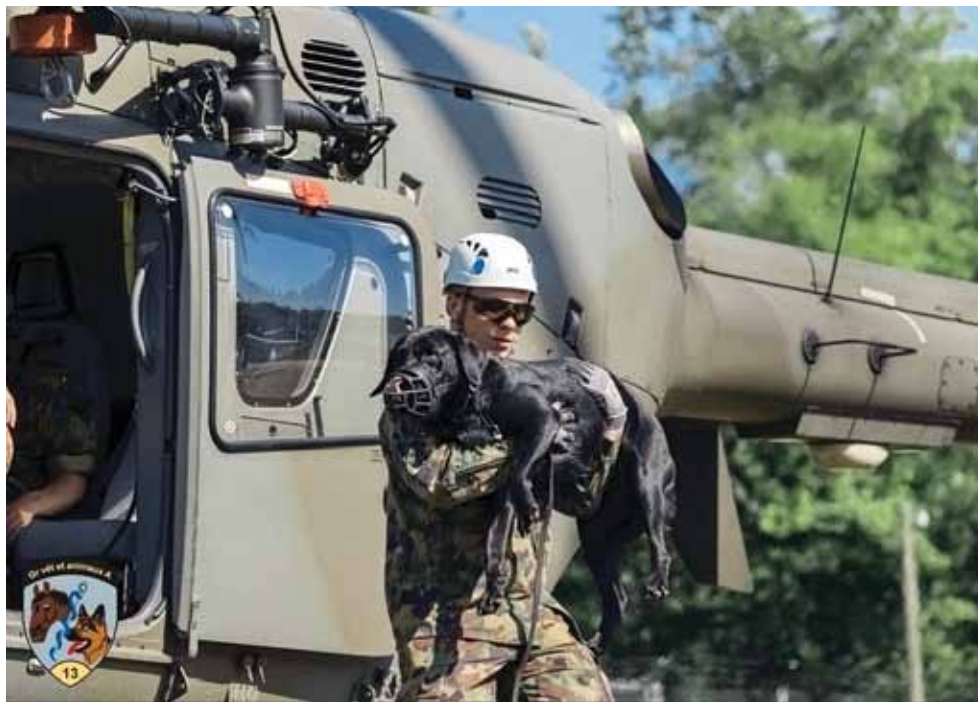
L'entraînement au vol en hélicoptère fait partie de la formation du conducteur de chien militaire destiné à devenir chien de sauvetage. Lors de cet exercice, les chiens doivent porter exceptionnellement une muselière.