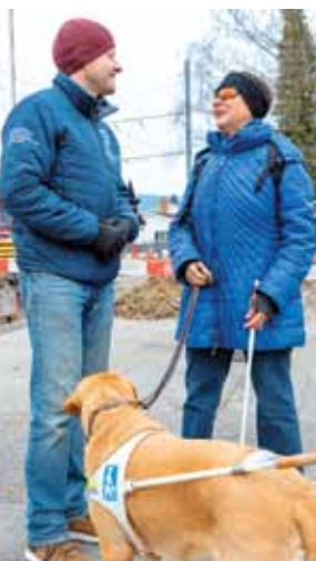
Echanges pendant la pause: qu'est-ce qui était parfait, que pourrait-on améliorer...