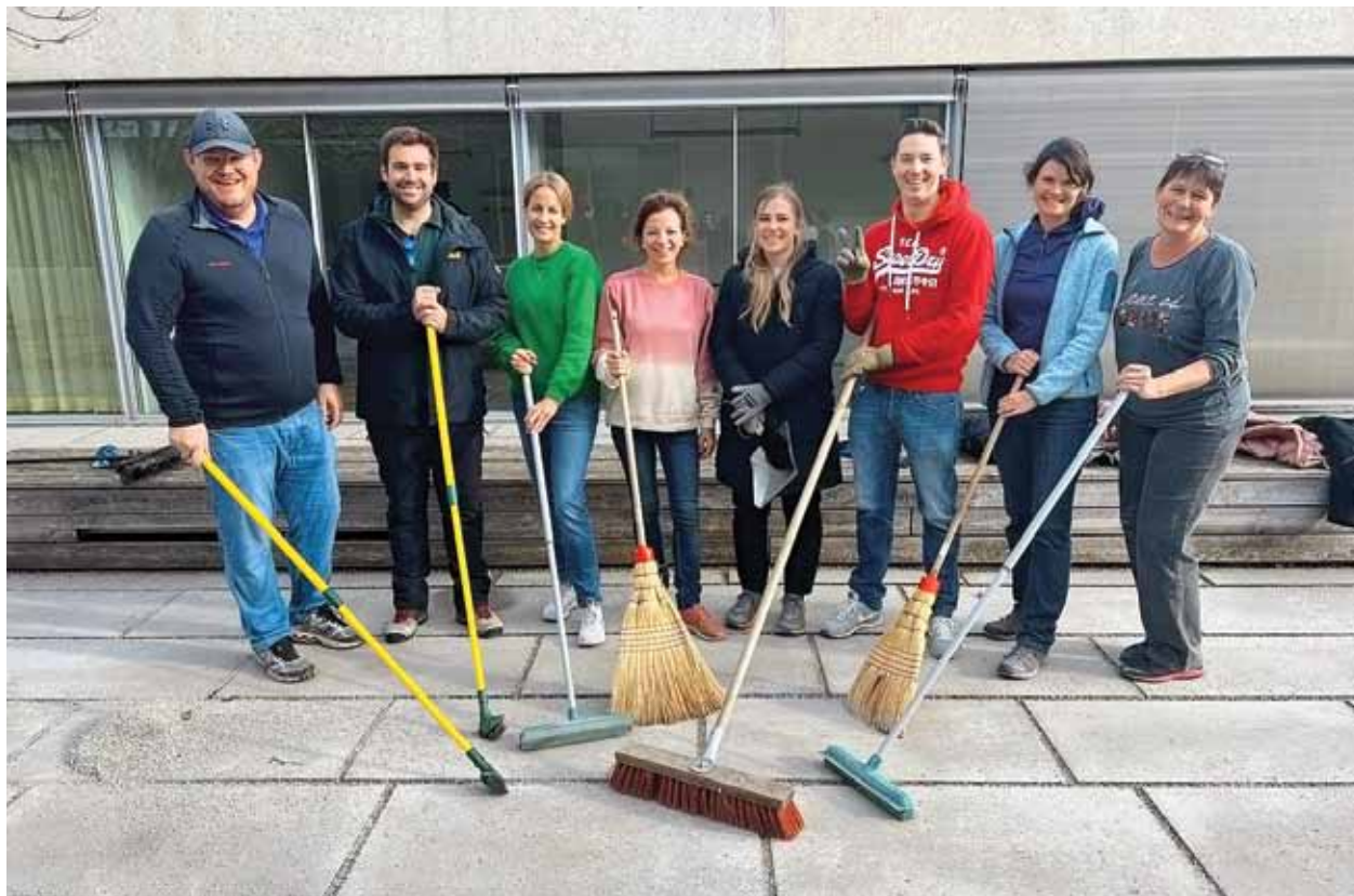
Du gravier, des balais et une tonne de bonne volonté. En novembre, des bénévoles du Crédit Suisse ont remis en état nos sentiers pavés et la cour intérieure de l'école. Un grand merci pour ce formidable travail.

Nous avons revu le déroulement des journées de visites chaque premier samedi du mois, pour les fixer à 10 et 14 heures. Cela permet de mieux planifier la présence du personnel en fonction du nombre de visiteurs. Ce changement a été bien accepté par nos hôtes. Pour ce qui est des dons, l'année 2022 fut assez stable. La rentrée de dons a cependant été moindre que l'année précédente. Des bénéfices substantiels ont toutefois été engendrés. Un grand merci à tous les donateurs et donatrices.