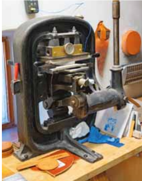
Mit der Prägpresse werden Logos und Firmennamen auf dem Leder angebracht.