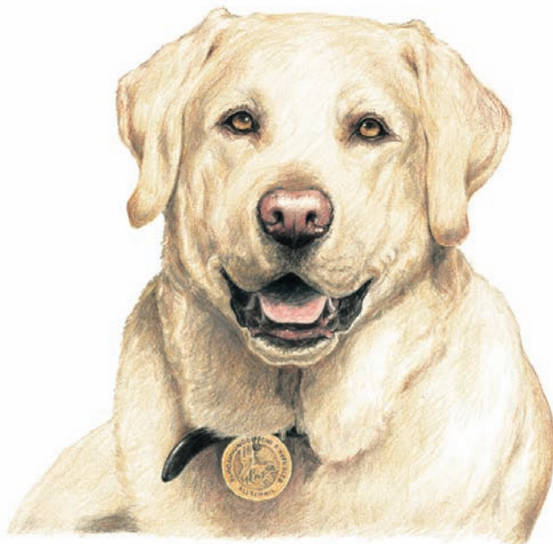
Tarik, im richtigen Leben Grover, der Blindenführhund.