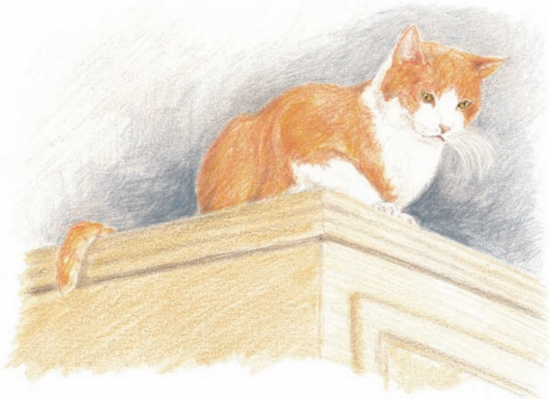
Minouche, im richtigen Leben Scottie, der Kater der Blindenführhundeschule.

Das perfekte Geschenk für kleine Leseratten!