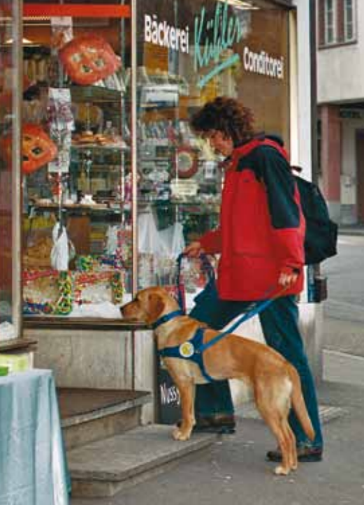
↳ L'accoutumance au harnais commence dès l'âge de cinq mois.

permettent de se sensibiliser aux exigences du futur travail de chien-guide.